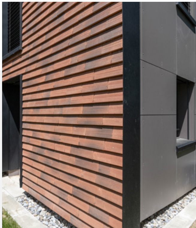
Les tuiles en terre cuite enveloppent toits et façades des bâtiments rénovés de la résidence du Möslweg à Köniz (BE).

Un emplacement idéal dont profitent aussi les habitants d'une résidence située dans le Möslweg, à l'extrémité ouest du quartier. Depuis 2022, cet ensemble de trois immeubles du début des années 1980 fait l'objet d'une rénovation complète par étapes successives, assortie d'un agrandissement. À l'issue des travaux, la résidence comptera 51 appartements de 1,5 à 5,5 pièces. Les travaux de transformation permettront une nette amélioration du confort: tous les logements disposeront par exemple de parquet en chêne et d'un grand balcon ou d'une terrasse.