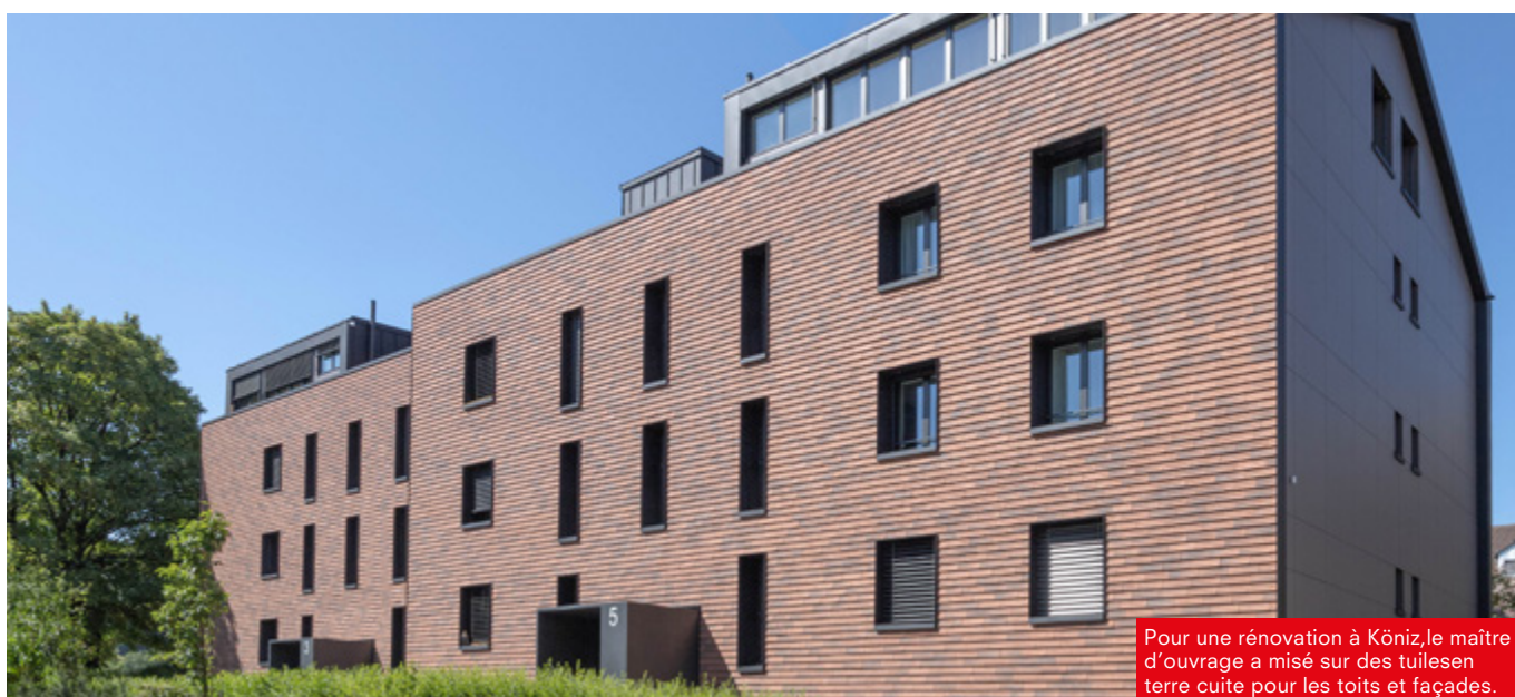
Pour une rénovation à Kôniz, le maître d'ouvrage a misé sur des tuiles en terre cuite pour les toits et façades.

Le bilan écologique d'un bâtiment dépend des émissions liées à sa construction mais aussi à l'entretien, à la maintenance et aux remplacements futurs. Ces dernières représentent près de 80% des émissions sur l'ensemble du cycle de vie. Pour assurer la compatibilité climatique des bâtiments, il faut donc miser sur des matériaux ayant une durée de vie similaire à celle de la structure primaire, au moins 80 ans et plus. C'est le cas des enveloppes de bâtiment en briques apparentes, tuiles ou panneaux de façade en terre cuite.