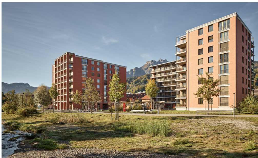
Le site de la tuilerie situé à Horw est un quartier durable qui se démarque par ses façades en briques caractéristiques et son aménagement naturel.