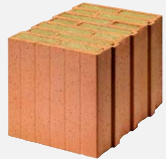
Brique grand format avec matériau isolant d'origine minérale

Les briques grand format sont des briques alvéolaires avec des parois en argile, dont les pores fins garantissent une isolation thermique élevée. Lorsque les alvéoles sont remplies de matériaux isolants d'origine minérale ou de la laine de mouton, la qualité d'isolation est encore meilleure. Mais l'argile stocke également la chaleur. Les briques grand format permettent de dresser des murs extérieurs monolithiques, qui ne requièrent aucune isolation supplémentaire. Comme toutes les briques, elles sont naturellement esthétiques, apportent une isolation thermique de qualité et ont une excellente influence sur le climat intérieur. De plus, leur fabrication est économe en ressources et elles sont durables, car les trajets de livraison sont courts, leur durée de vie est longue et leur utilisation en tant que matière première est prometteuse.