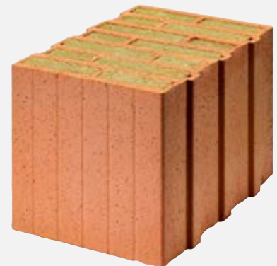
Brique grand format avec matériau isolant d'origine minérale

Les briques grand format sont des briques alvéolaires avec des parois en argile, dont les pores fins garantissent une isolation thermique élevée. Lorsque les alvéoles sont remplies de matériaux isolants d'origine minérale ou de la laine de mouton, la qualité d'isolation est encore meilleure. Mais l'argile stocke également la chaleur. Les briques grand format permettent de dresser des murs extérieurs monolithiques, qui ne requièrent aucune isolation supplémentaire. Comme toutes les briques, elles sont naturellement esthétiques, apportent une isolation thermique de qualité et ont une excellente influence sur le climat intérieur. De plus, leur fabrication est économe en ressources et elles sont durables, car les trajets de livraison sont courts, leur durée de vie est longue et leur utilisation en tant que matière première est prometteuse.